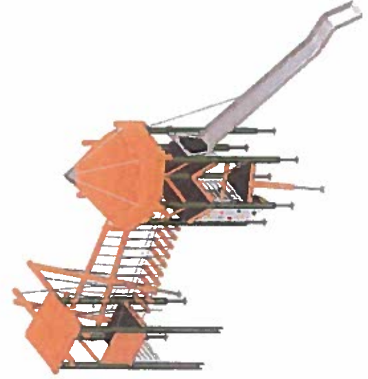
Artikel 52599700276 Spielanlage Jahnschule Lärche grün-natur, Rutsche GFK mit Edelstahlbelag