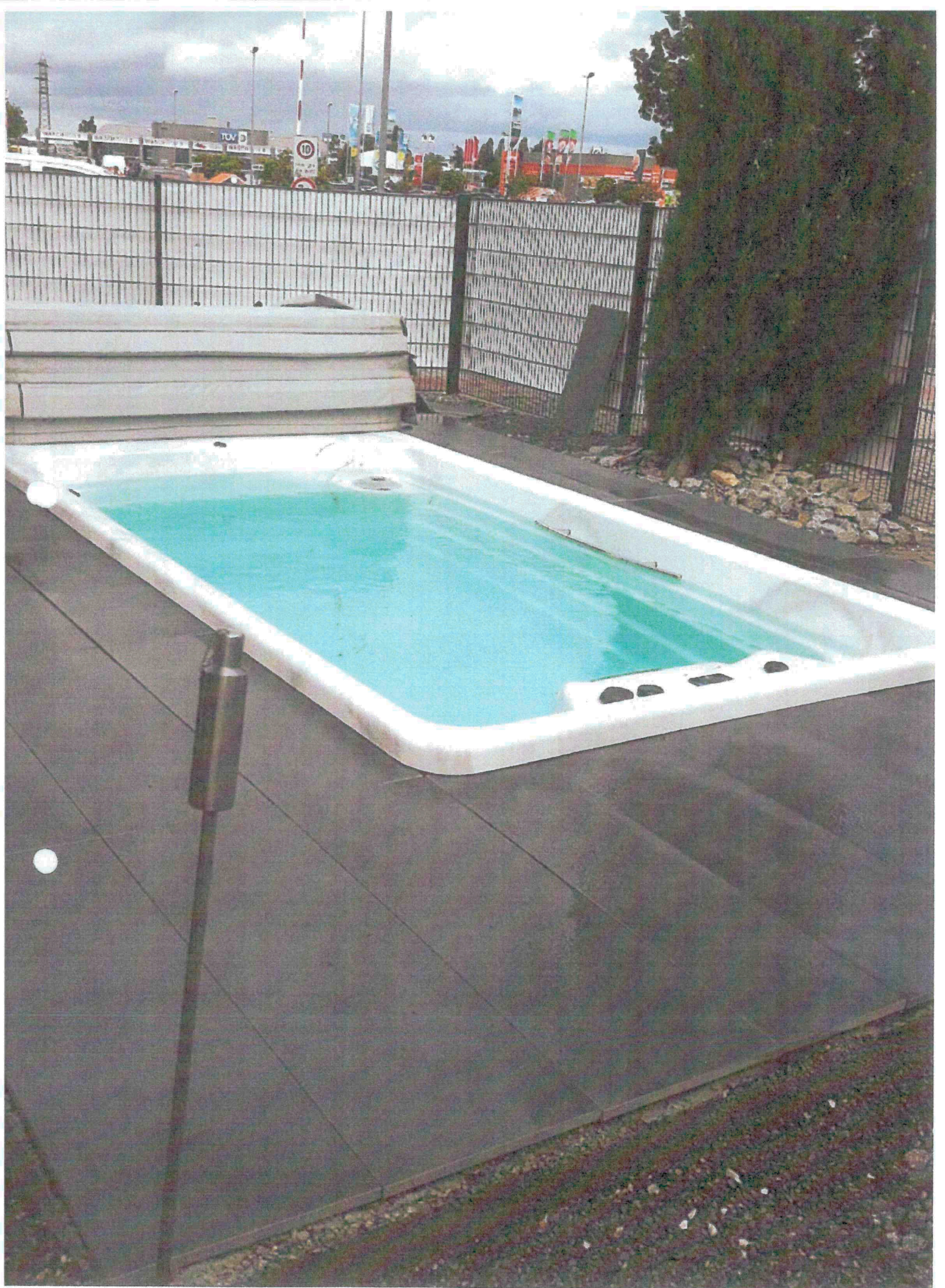
Swim Spa SP 1000 4,00m x 2,30m