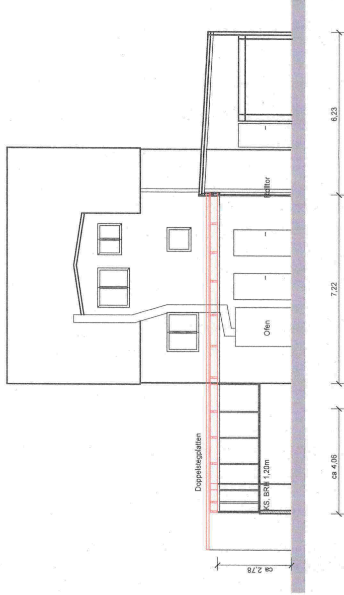
Schnitt A - A

Sch. Golke & Weinand BAUFÜHRER ARCHITECT