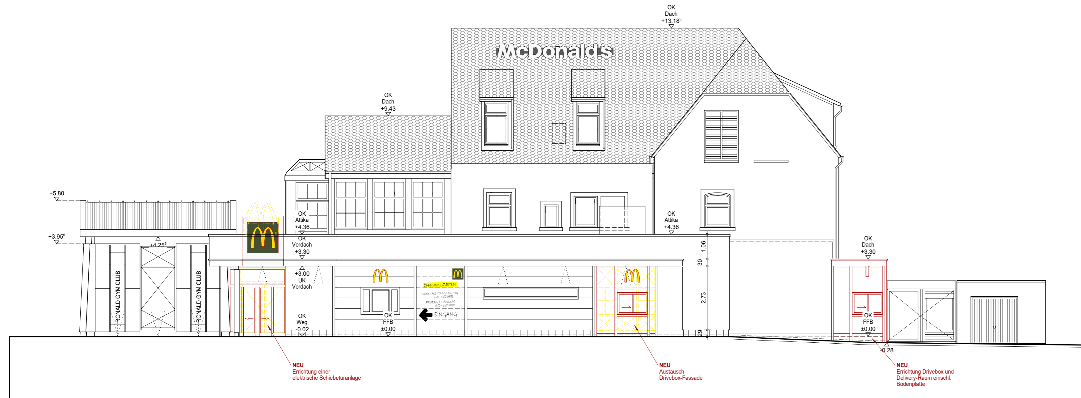
ANSICHT WEST (HAUPTINGANG / DRIVE SPUR)