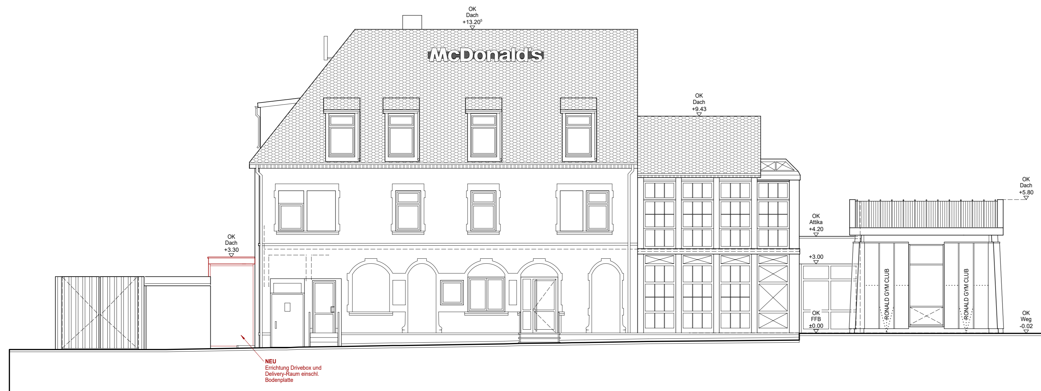
ANSICHT OST (RÜCKSEITE)